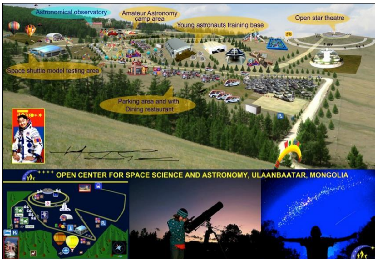
Зураг 3. Астроланд цогцолборын төсөөлөл

Богдхан уулын Хүрэлтогоотод байрлах Одон орон судлах оргилыг түшиглэн одон орон сансар судлалын шинжлэх ухааныг нийгэмд таниулан сурталчлах, оюутан хүүхэд залуучуудад орчлон ертөнцийн үүсэл хөгжил, од эрхсийн хөдөлгөөн, тэнгэрийн мандал дахь одон орны онц содон үзэгдлүүдийн талаар шинжлэх ухааны бодит тайлбар мэдээлэл өгөх, иргэдэд шинжлэх ухаалаг аялал жуулчлалын үйлчилгээ үзүүлэх, эх орныхоо хөх цэлмэг одот тэнгэрийг гадаадын жуулчдад үзүүлэх зорилго бүхий Одон орон – сансар судлалын Астроланд цогцолборыг байгуулна.