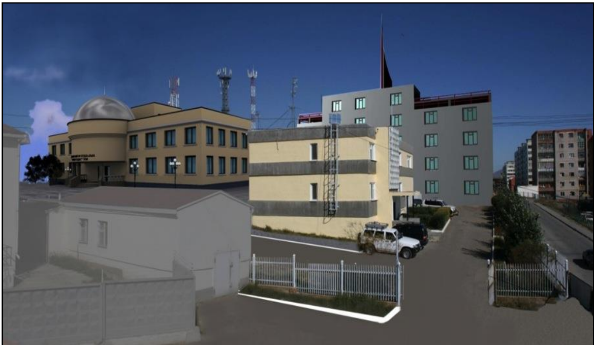
Зураг 2. Хүрээлэнгийн төв байрны өргөтгөлийн ерөнхий төлөвлөгөө.

Хүрээлэнгийн төв байрыг өргөтгөх төлөвлөгөөг Захиргааны Зөвлөлийн хурлаар хэлэлцэн баталж ерөнхий төлөвлөгөөг хэрэгжүүлэх арга замуудыг тодорхойлно. 2025 он хүртэлх хугацаанд Хүрээлэнгийн өргөтгөлийн барилгыг барьж ашиглалтад оруулах талаар идэвхтэй ажиллана. (Зураг 5.)