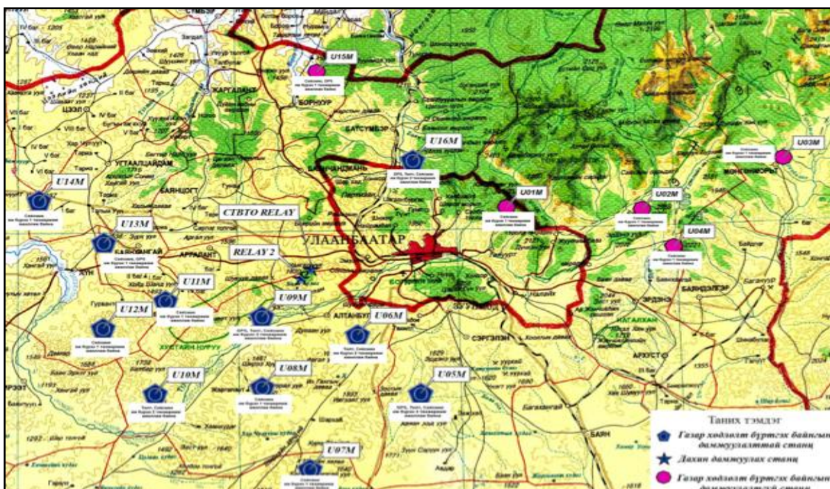
Зураг 5. Геофизикийн хамтарсан төвийн станц байрлах цэгүүд