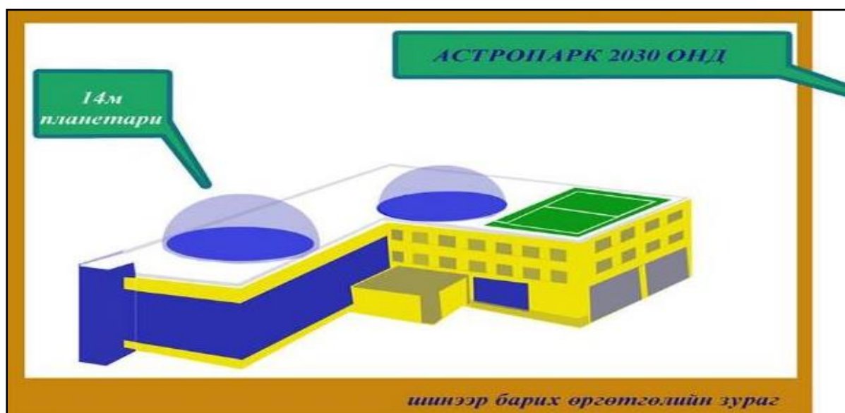
Зураг 7. Өргөтгөлийн план зураг