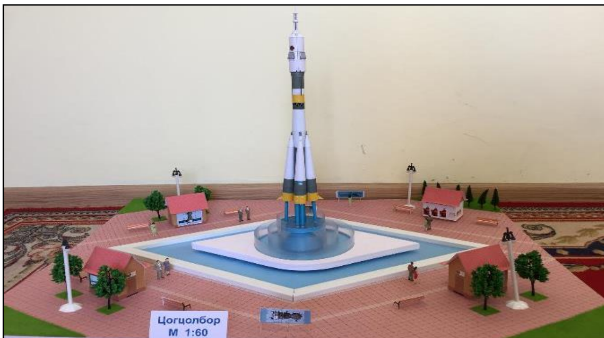
Зураг 4. Сансрын нисэгчдийн талбайн макет

19. Геофизикийн хамтарсан төв, Сургалт судалгааны полигон, Сансар судлалын газрын тулгуур цэгүүд